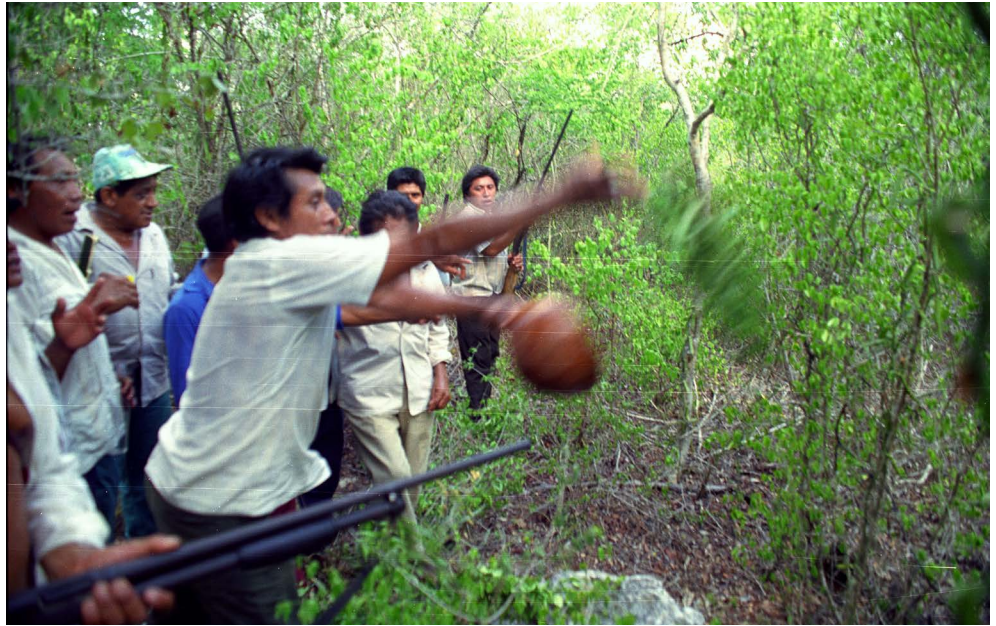
35. 2120 Loj Kaj 37.jpg