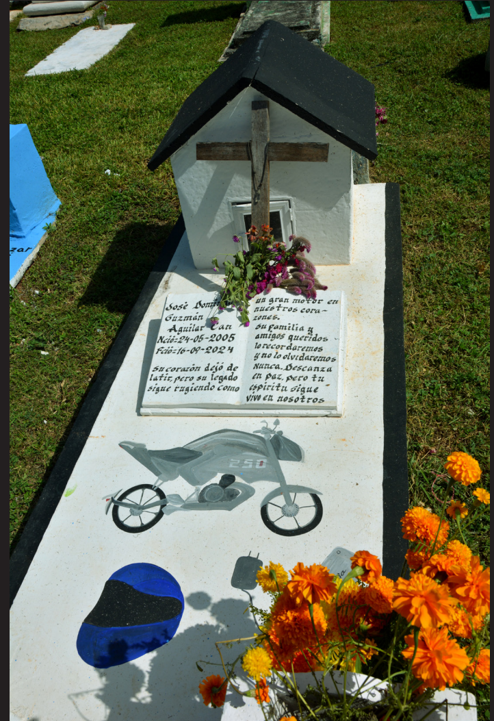
241102 Hoctun 38