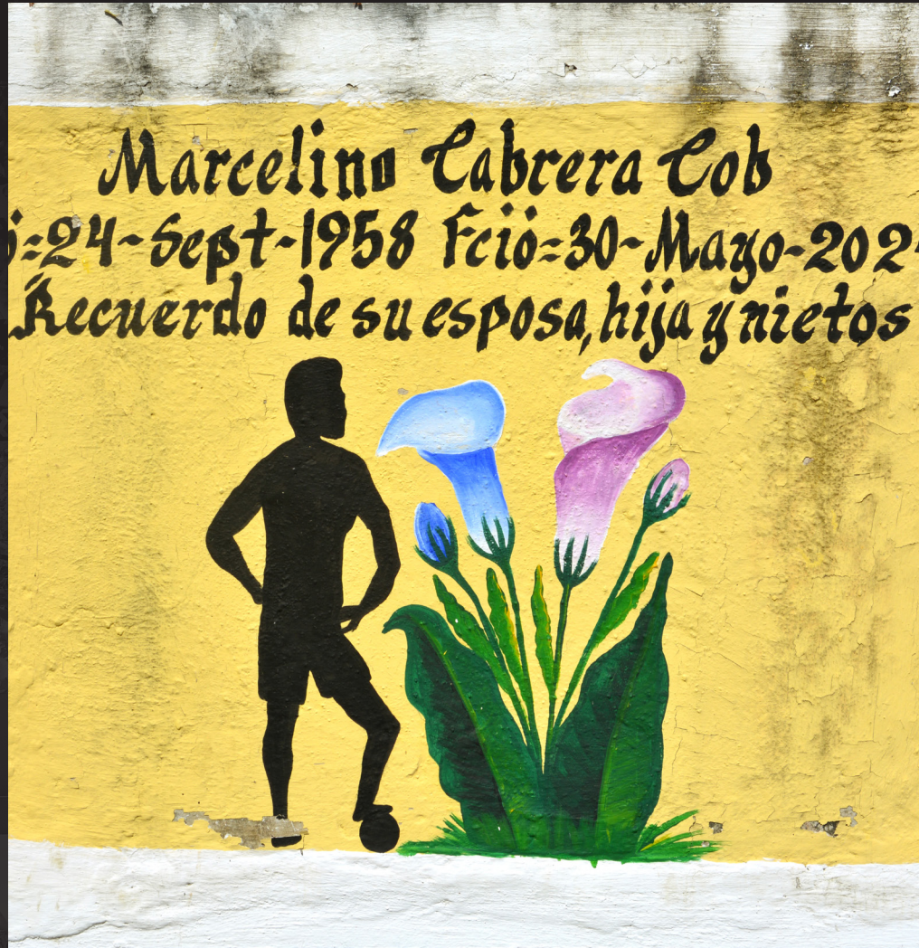
Al pintor de tumbas Edy Godínez ni marcaron su tumba con una pintura