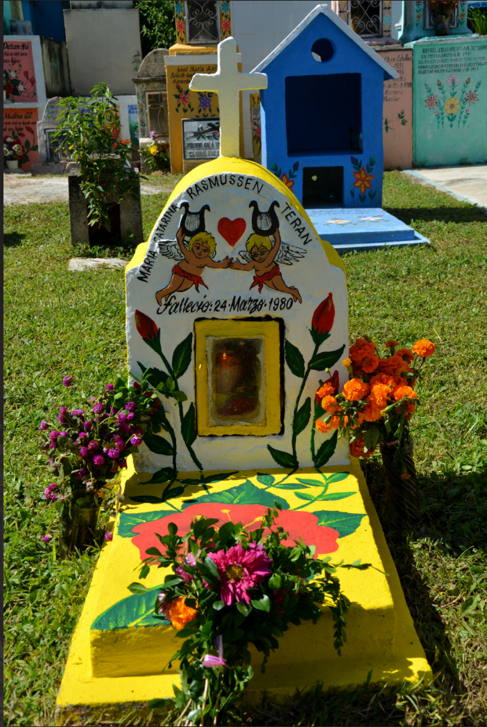
241102 Hoctun 01