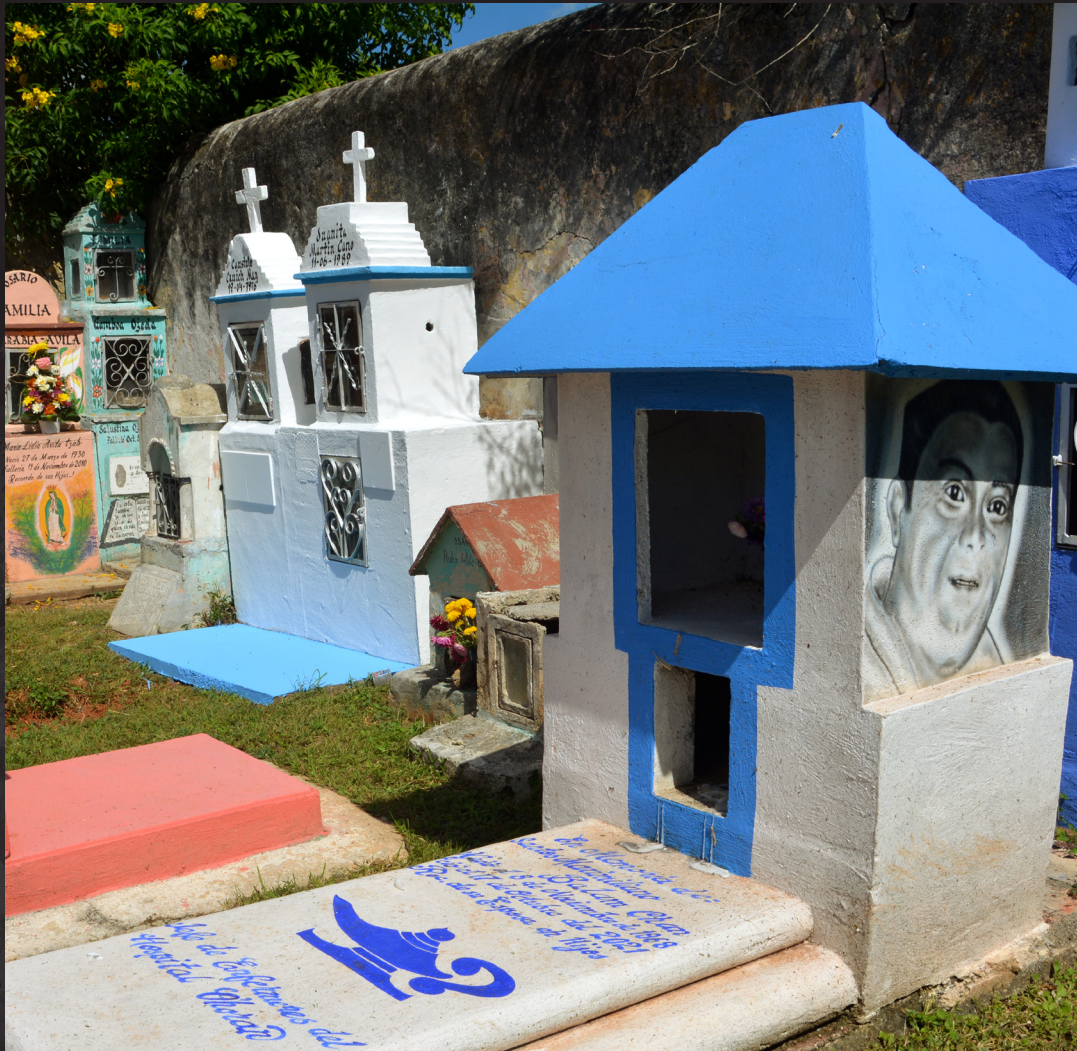
241102 Hoctun 43