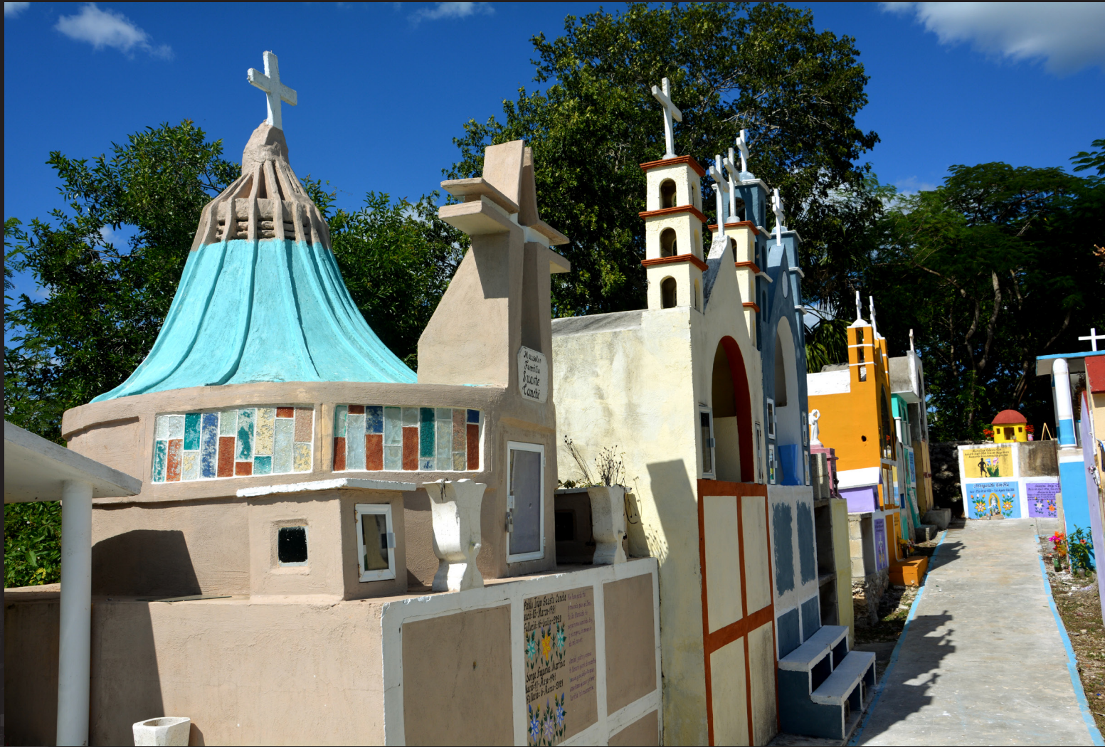
Aquí esta la Catedral de la Virgen Guadalupe, y la iglesia de Hoctun.