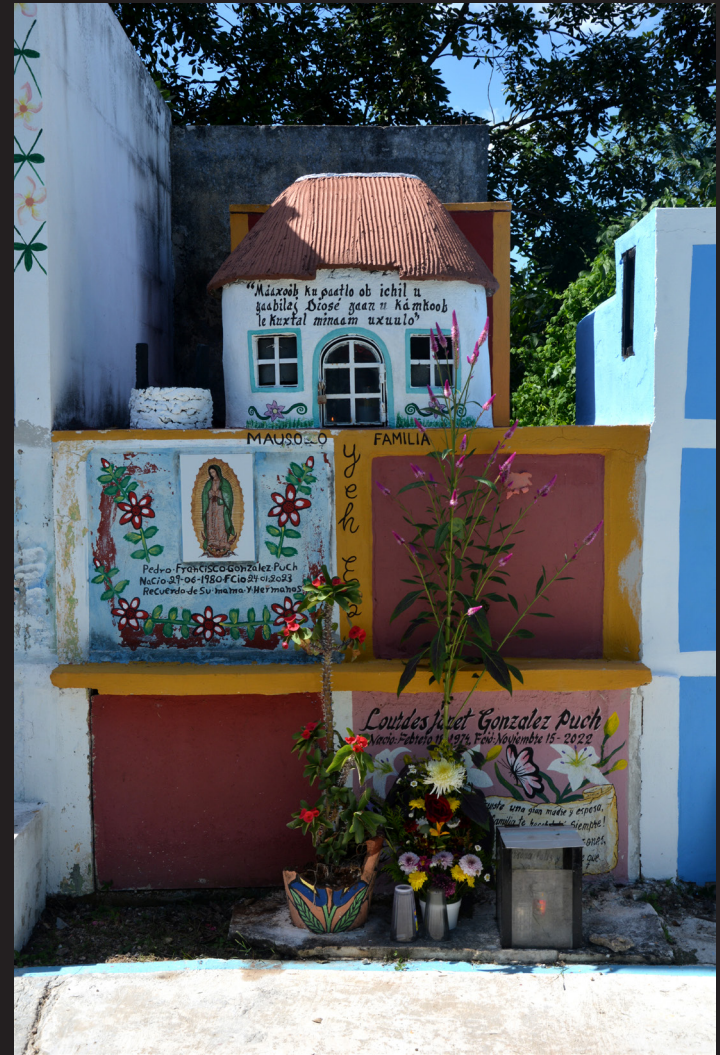
241102 Hoctun 08