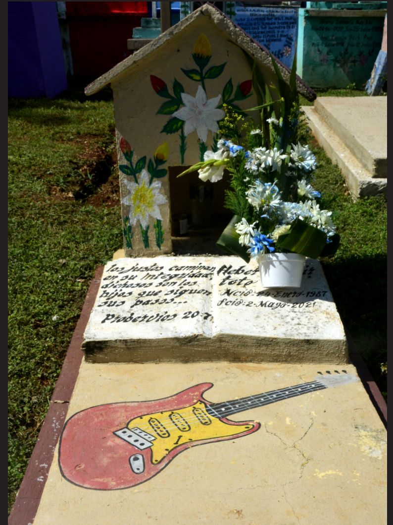
241102 Hoctun cementerio 21