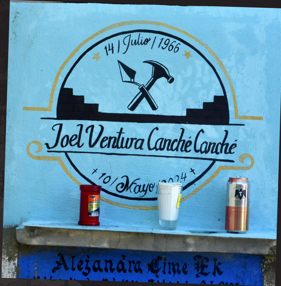
241102 Hoctun cementerio 14